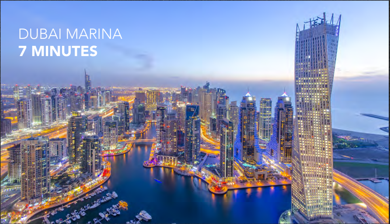
DUBAI MARINA 7 MINUTES