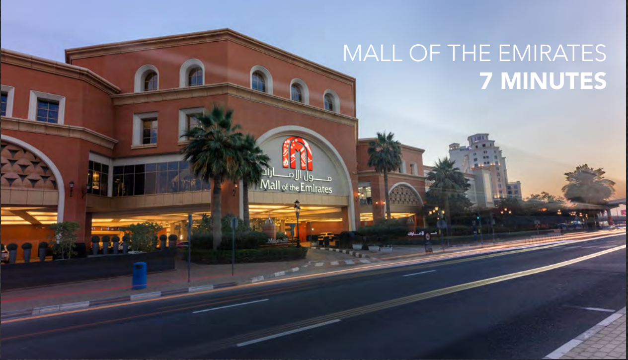
MALL OF THE EMIRATES 7 MINUTES