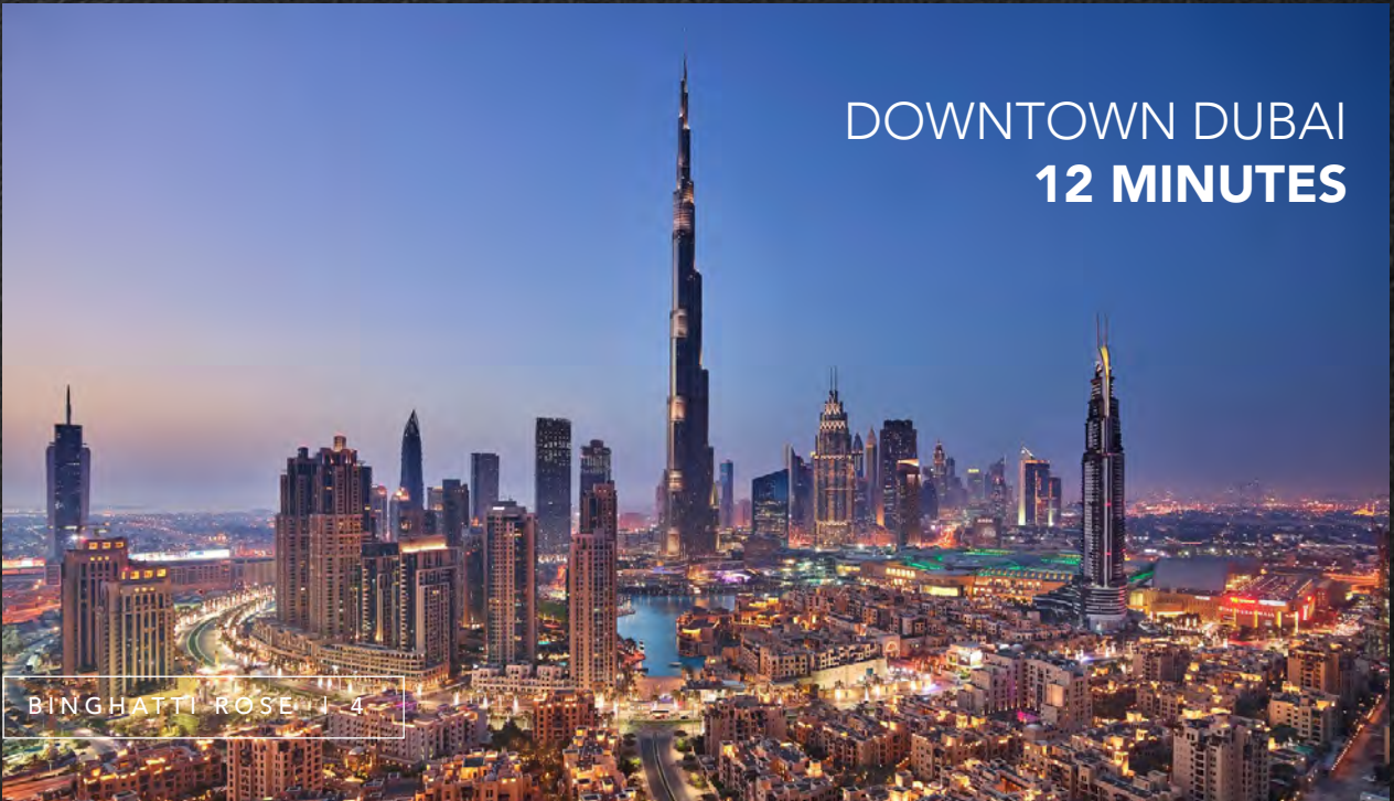
DOWNTOWN DUBAI 12 MINUTES