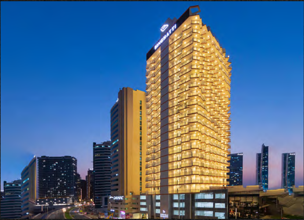
MILLENIUM BINGHATTI RESIDENCE