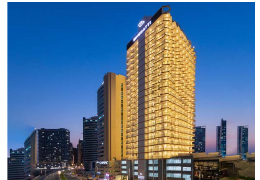
MILLENIUM BINGHATTI RESIDENCE