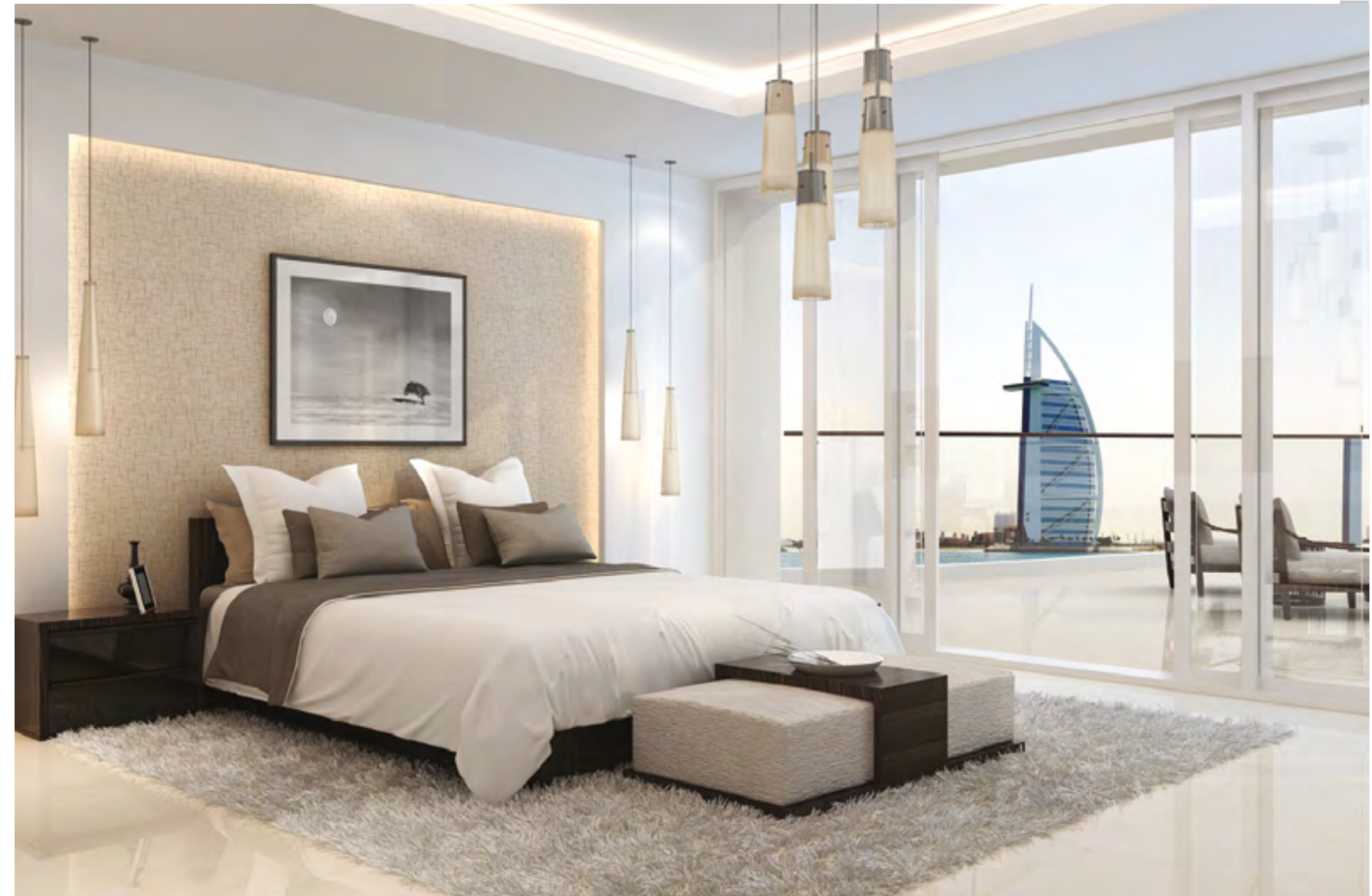
Spacious and well-designed bedrooms with floor-to-ceiling windows and large terrace provide sea view and privacy. All bedrooms are en suite.

التصميم الداخلي الأنيق لغرف المعيشة، مع أرضيات رخام، وخطوط واضحة، والألوان محايدة وتشطيبات دقيقة.