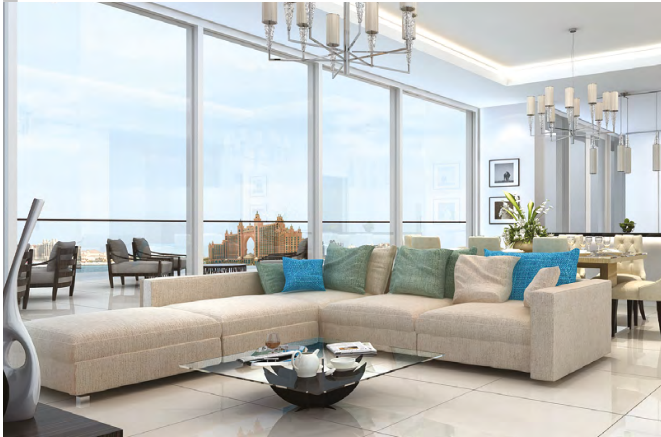
Sleek living room interiors with clean lines, neutral tones and meticulous finishes.

التصميم الداخلي الأنيق لغرف المعيشة، مع أرضيات رخام، وخطوط واضحة، والألوان محايدة وتشطيبات دقيقة.