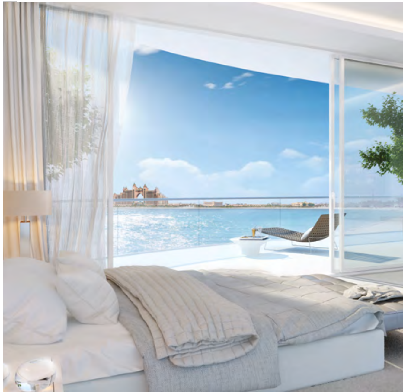
Large private terraces perfectly orientated with views of the Atlantis Hotel and Dubai skyline.

شرفات خاصة واسعة، مواجهة لإطلالات أتلانتيس ومناظر مدينة دبي الساحرة.