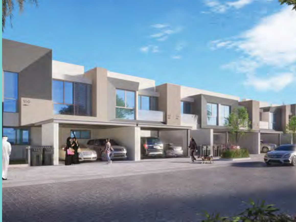
غاردينيا تاون هومز II

لنلق نظرة سريعة ونجد المنزل المثالي لك بما يلبي طموحك... أولويتنا هي راحتك، كل يوم.