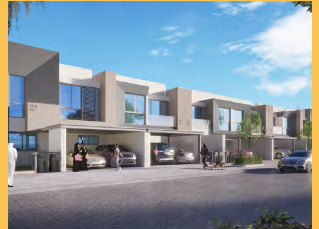
Gardenia Townhomes II