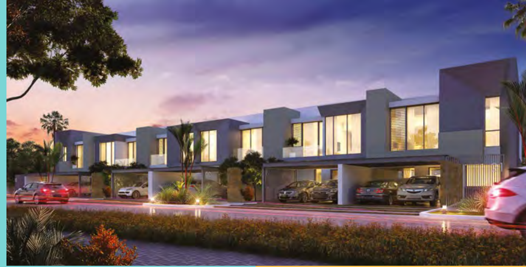
غاردينيا تاون هومز