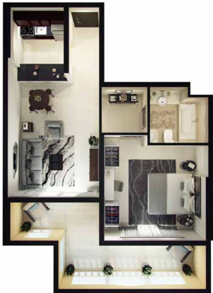
1 Bedroom Type-2