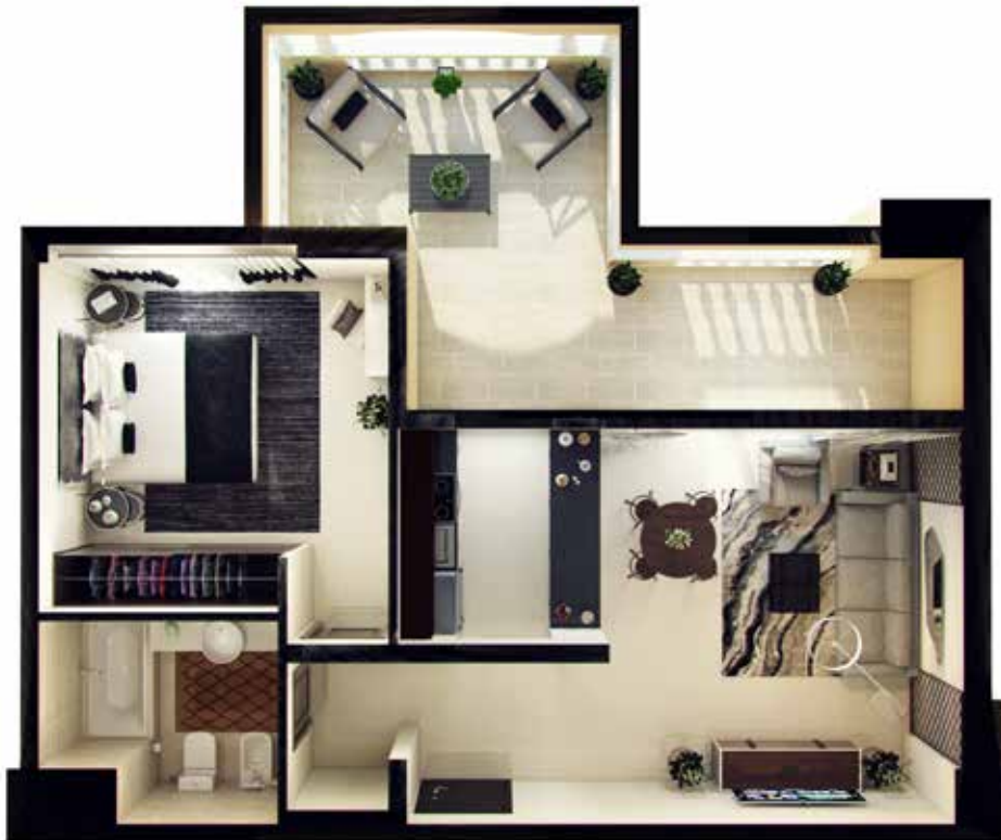
1 Bedroom Type-1