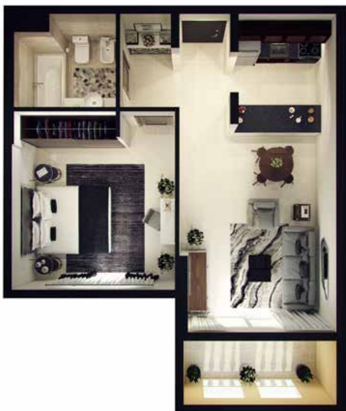
1 Bedroom Type-4